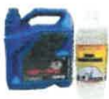
les produits toxiques