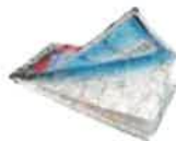
les cartes routières