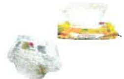
Les couches et papiers imbibés

Ces déchets sont à apporter en déchèterie