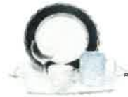
la vaisselle (pyrex, porcelaine, vitrocéramique, faïence)