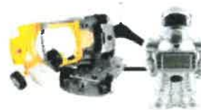
les objets et jouets en plastique