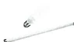
les néons, les ampoules basse consommation*