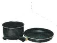
les objets métalliques