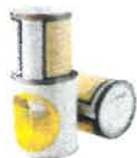
les pots et les bombes de peinture