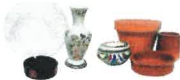
les objets en verre spécial, en porcelaine, en faïence et en terre cuite